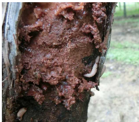
図-3 クビアカスカシバ幼虫による食入被害