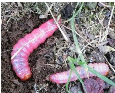
図-2 クビアカスカシバ老齢幼虫