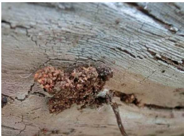
図-4 クビアカスカシバ幼虫の虫糞