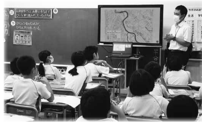
▲小学校で行われた「防災講座」の様子