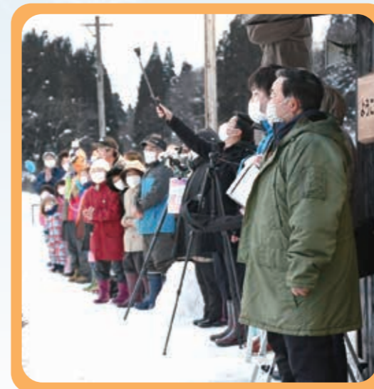
▲秋田内陸線スノーアート 点灯式