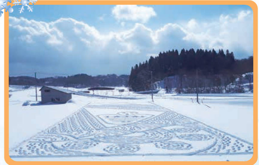
▲秋田内陸線スノーアート