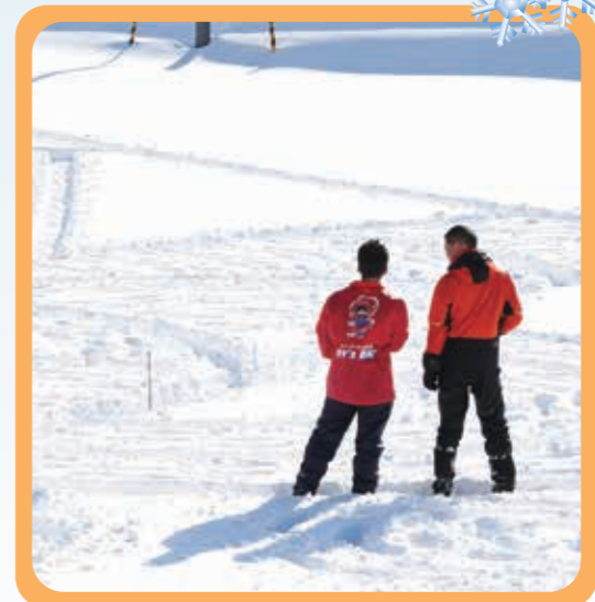
▲スノーアート制作中の様子