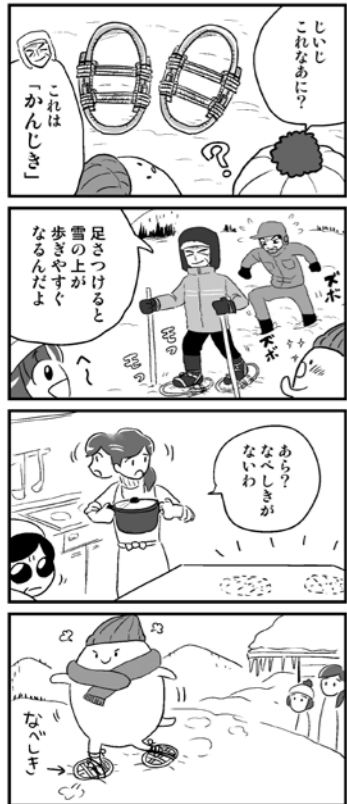
「かんじき」 作・ペタもっち