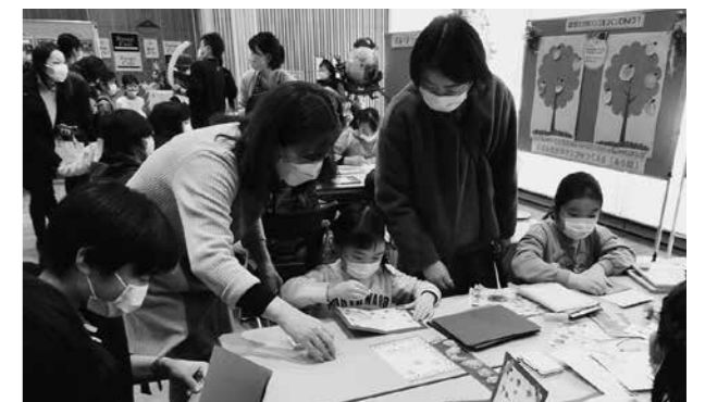
▲英語のクリスマスカード作りに挑戦 本が紹介されると、子どもから大人まで絵本の世界に引き込まれ、来場者の心を温かくしてくれました。

また、ステージ発表では、コムコム定期講座のギター演奏が行われたほか、「おはなしどんどこ」と東京都健康長寿医療センター研究所によるスペシャル絵本ライブが行われました。冬やクリスマスの絵