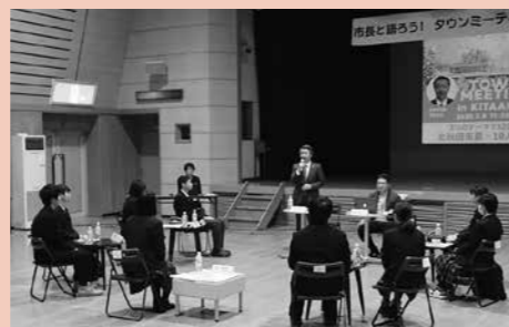
▲2020年のタウンミーティング(高校生)の様子