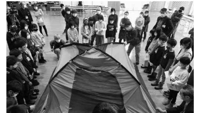
▲テントの設営方法を熱心に聞く子どもたち 地域と学校の枠を超えた交流をしました。子どもたちは、協力しながら学びの輪を広げ「また参加したい」という声も聞かれました。

また、秋田北鷹高校家庭クラブが協力して作ってくれた給食の後は、ALTの先生の英語の自己紹介を聞いてO×クイズをしたり、モンスターを描くなど、