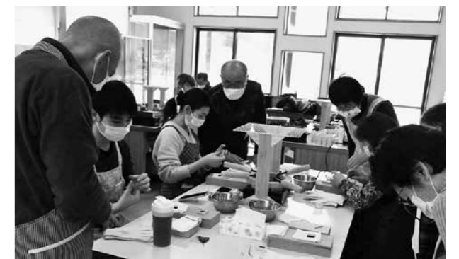
▲合川樺細工の魅力を伝えていく 第でピカピカに光っていく様子に驚いていました。