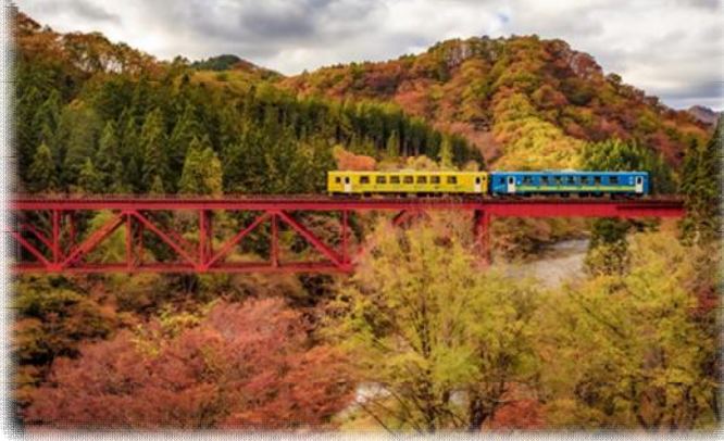
秋田内陸縦貫鉄道