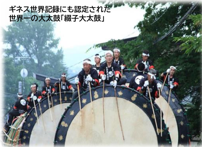
ギネス世界記録にも認定された 世界一の大太鼓「綴子大太鼓」