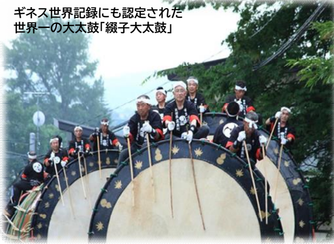
ギネス世界記録にも認定された 世界一の大太鼓「綴子大太鼓」