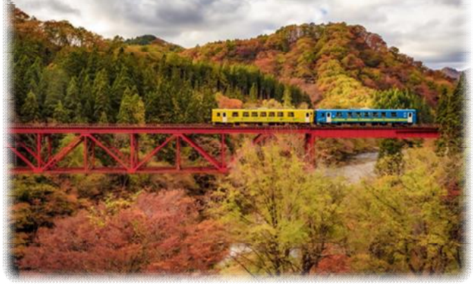
秋田内陸縦貫鉄道