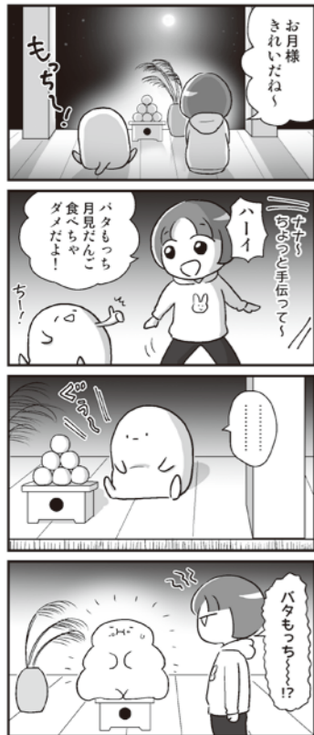
「バタもっち」9月よりだんご作バタもっち愛犬会