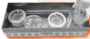
▲学校教育課長賞 「交かん式まんげきょう」