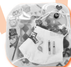
▲審査委員長賞 「かわいいマスクケース」