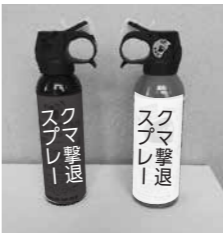
△市販のクマ撃退スプレー