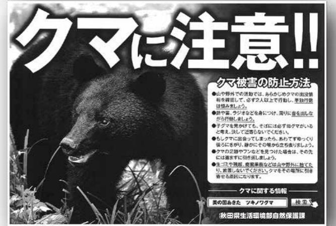
△県ではチラシを作成し注意を呼びかけています

クマの目撃が増加しております。クマとの遭遇に注意してください。クマは11月頃まで食べ物を探してよく動き回ります。クマによる被害が発生する前に、電気柵の設置や刈り払いによる緩衝帯整備、果実の早期収穫や放置果樹の伐採を行うようにしてください。人とクマとの出会いを避ける工夫が事故防止につながります。