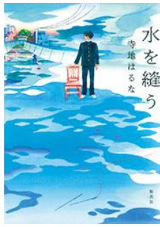
「水を縫う」 寺地 はるな/著