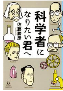
「科学者になりたい君へ」 佐藤 勝彦/著