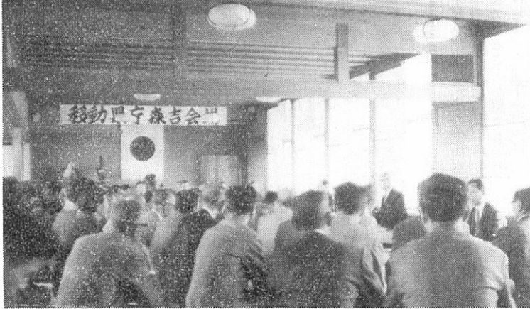
(移動県庁森吉会場)

つ頃完成するののか。小滝の道路事情はよくわかる。問題は土地買収が進まないことと橋が多いことである。地元側でないか。