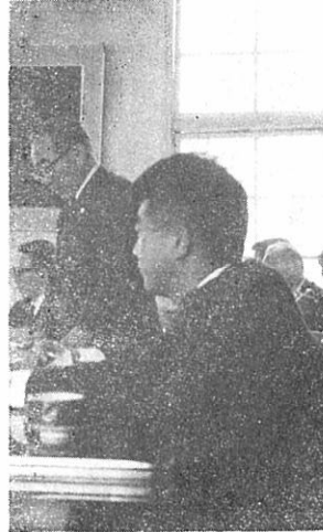
(施政方針をのべる赤石町長)