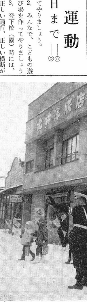
（横断は手をあげて正しく）

えた部分についても奨励補 助金は交付します。 七、奨励金は、国が農業者 に交付する直接補助金とす る。 八、自主的に生産調整の減 反を希望するときは、減反 申請書を出してもらう。 九、四十四年に作付した水 田を減反する面積は、すべ て奨励金の対象にする。