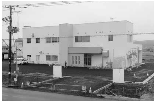
北秋田市し尿処理施設（4月1日供用開始）