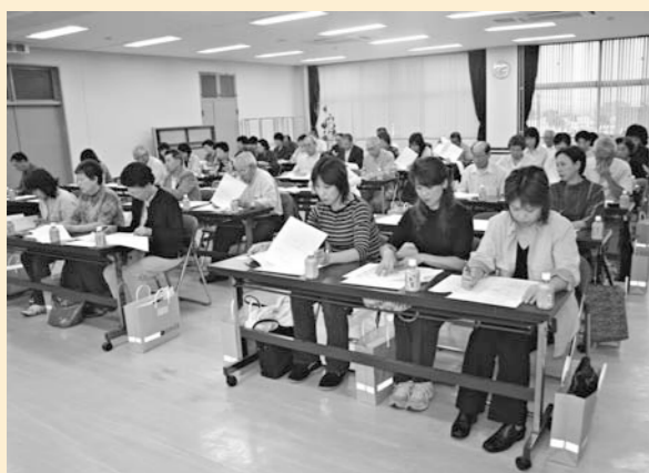
旧町ごとに行われた国勢調査員説明会（鷹巣地区）

調査員は、市長の推薦に基づいて総務大臣が任命した非常勤の国家公務員です。鷹巣地区140人、合川地区51人、森吉地区55人、阿仁地区36人、総勢282人となります。