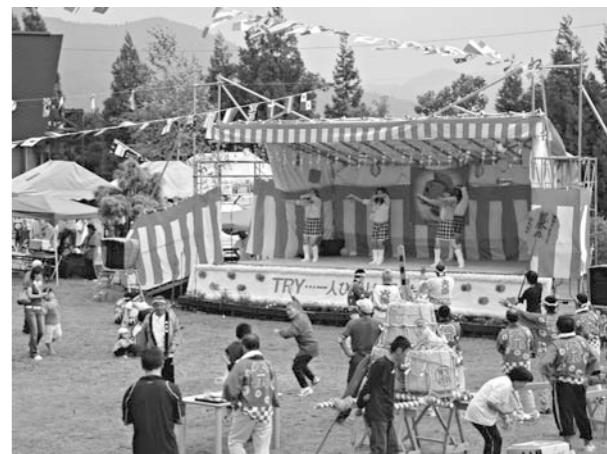
お祭りムード一杯のなか、地域の皆さんと交流