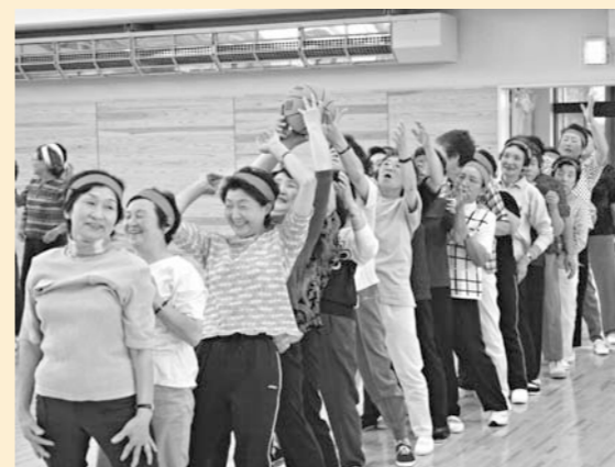
笑顔で「ボール送り競技」をする会員の皆さん