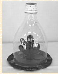
「サボテンのわなげ」

【工夫したところ】 空気穴をつけていない時、自然に戻らなかったため空気穴をつけました。ゴミ箱の重心が大きいダンボール箱からでないように、支点を調節して作りました。