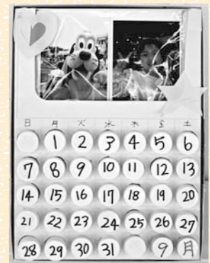
「ずっとカレンダー」