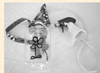
「らくらくスプレー」