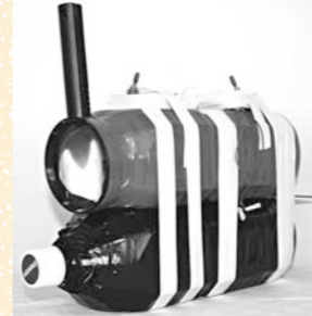
「ボトルプロジェクター」