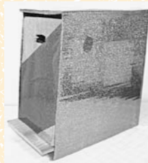
「ダンボールごみ箱」

【工夫したところ】 身の回りにある物を使って好きなカブトとクワガタを作りました。ねじで目玉を作り洗濯ばさみとフックでつを作りました。足は針金を使い動くように工夫しました。