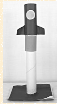
「びゅんびゅんロケット」