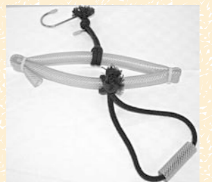
「らくらくハンガー」