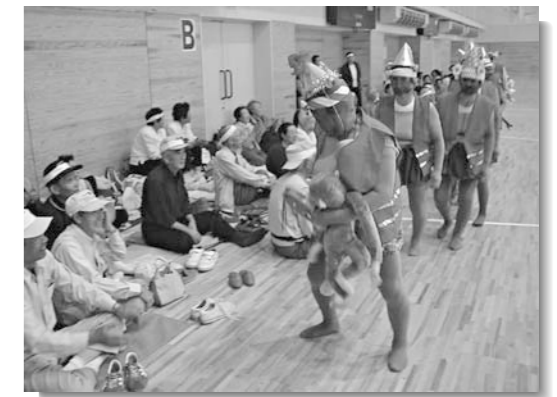
工夫を凝らした仮装に大爆笑