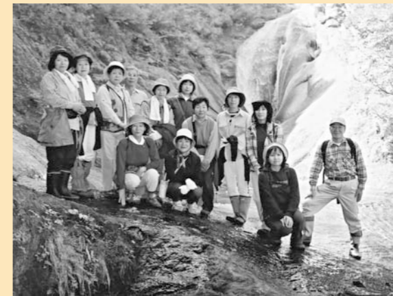
奥森吉の雄大な自然を満喫した講座生ら

当日は、森吉山野生鳥獣センターにて自然観察指導員の説明を受けながら見学をしました。その後、桃洞の滝まで往復約2時間半かけ、歩道沿いに生えているキノコを採ったり、美しく色付いた景色をカメラに収めたり、大自然を満喫してきました。