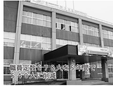
職員定数678人を5年間で540人に削減

本年度は、限られた財源を最大限有効に活用する観点から、経費の一層の節減合理化と事務事業の見直しを図り、費用対効果を勘案した各種施策で、市民福祉の向上に一層の努力を払います。