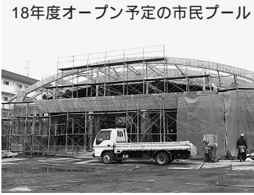
18年度オープン予定の市民プール

スポーツ施設等 平成18年度にオープンする市民プールの利用拡大 国体関係 平成19年に開催される秋田わか杉国体のリハーサル大会として全日本社会人ターゲットアーチェリー選手権大会、全日本フエニング選手権を開催 秋田わか杉国体の「炬火採火地」に道の駅あにマタギの里が決定、国体成功に向け、意識高揚を図る啓蒙活動を推進