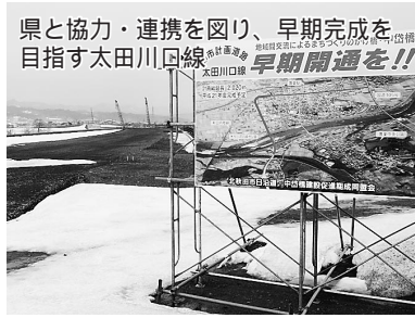
県と協力・連携を図り、早期完成を目指す太田川口線 早期開通を!!