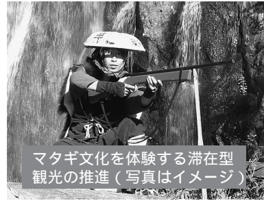
マタギ文化を体験する滞在型観光の推進（写真はイメージ）

合併時の職員定数678人を今後5年間で約20%減らし、540人に削減 三位一体改革に伴う集中改革プランの進行管理を行い、行政の身軽な体制強化を促進 秋田内陸線再生計画の実施 雇用の確保を図る新たな企業誘致と既存企業の支援強化 限られた財源による、山積する行政課題への取り組み 個人情報不正使用と漏えいの防止 ホームページで市の情報を全国発信