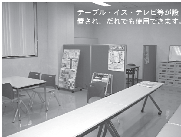
テーブル・イス・テレビ等が設置され、だれでも使用できます。