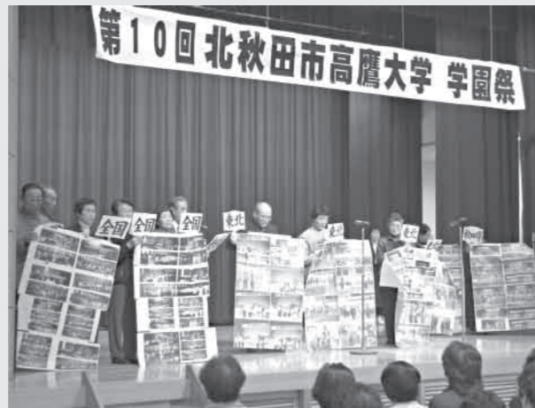
▲日頃の活動の成果を表現豊かに披露した第10回高鷹大学学園祭「発表の部」

また、4日の発表では、多彩な出し物が演じられました。ユニカールクラブは、写真やマグネットを使って、競技方法や大会の様子をわかりやすく説明していました。最後には、恒例になった参加者全員での「北国の春」を合唱し、観客からは大きな拍手がわき起こり、満面の笑顔で終了しました。