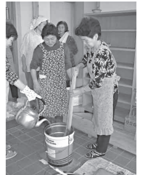
▲廃油を利用した環境にやさしい手づくり石けんづくりに挑戦した荒瀬婦人会のみなさん