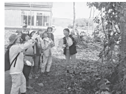
▲自然観察で地域の魅力を再発見

中央公民館講座「気楽にスポーツ」では10月5日、紅葉できれいに色づいた桃洞の滝へのウォーキングを行いました。