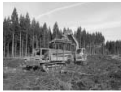
建設地を重機で伐採