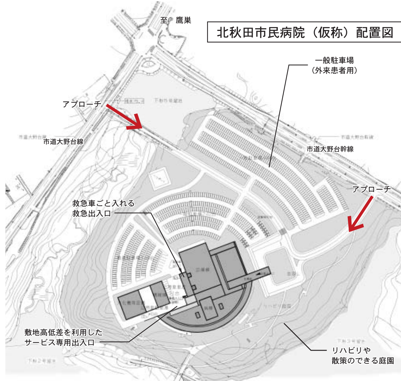
北秋田市民病院（仮称）配置図