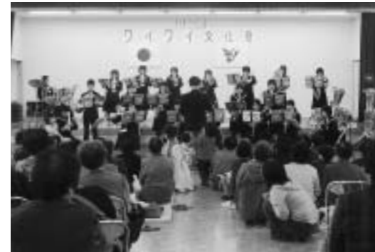
▲“ワイワイ”楽しんだ地区文化祭

第3回をむかえた沢口公民館の「ワイワイ文化祭」が11月23日、開催されました。文化祭は、地区住民がステージ発表などで「わいわい楽しみ互いに交流しよう」と開かれているもので、今年も地区の保育園児、小中学生、公民館講座の受講生らが歌や踊り、器楽演奏などを発表、参観者と一体となって交流の輪を広げました。