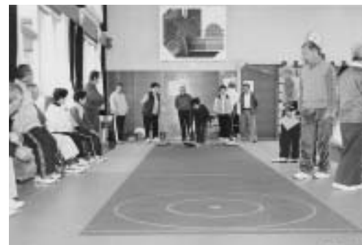
▲初心者でも気軽に楽しめる「ユニカール」

第1回綴子地区ユニカール大会が、11月26日綴子公民館で開催されました。大会には14チーム、42人の選手が参加、熱戦を繰り広げました。