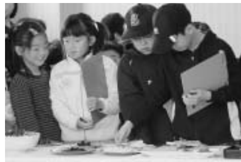
▲真剣に審査に臨んだ子ども審査員