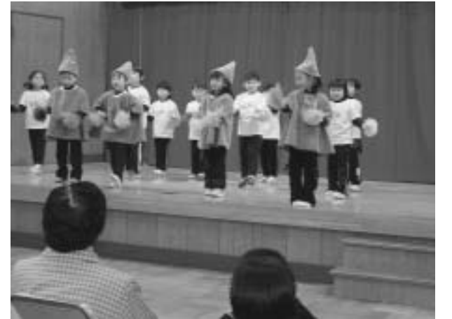
▲大阿仁保育園の園児によるお遊戯「スギッチダンス」にも大きな拍手が送られました