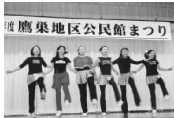
▲坊沢公民館のダンスサークル「ゴリエアロ」

12月3日、中央公民館にて平成18年度「鷹巣地区公民館まつり」が開催されました。