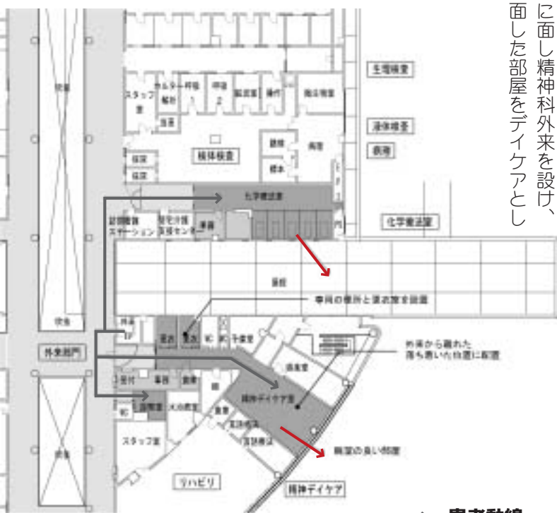
2階 化学療法室・精神デイケア廻り

・一般の外来から離れた位置に配置し、プライバシーと落ち着いた環境を確保します。 ・デイケアは明るく眺望の良いしつらえとし、患者やスタッフが治療に専念できる環境を整えます。