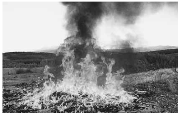
▲野焼きはダイオキシン類などの有害物質を発生させるため絶対に止めましょう

例 どんと焼き等の地域の行事における 不要になった門松、しめ縄等の焼却 ※例外に当てはまる野焼きをする場合 でも、周囲への生活環境には十分な配 慮が必要となります。