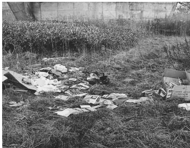
▶米代川河川敷に投棄されたごみ。警察に引き 渡した後、不法に投棄した人が特定され、罰 金刑に処せられました

この自然豊かな美しい北秋田市にも、 廃棄物の不法投棄が後を絶ちません。 空き缶などのポイ捨てごみやベットの フンに始まり、テレビや冷蔵庫などの 家電ごみ、中には農機具や車、タイ ヤなど、処理に困るものがごみとして 沢山捨てられています。 中には、ごみを目立たないようにす るためか、わざと不法投棄ごみを道端 から谷底に落とすように捨てている悪 質なケースも確認されています。 ちなみに昨年度は、悪質な不法投棄 事件を警察に引き渡し、処罰を受けた ケースも何件もあり、中には数十万円 の罰金刑に処せられたケースもありま した。