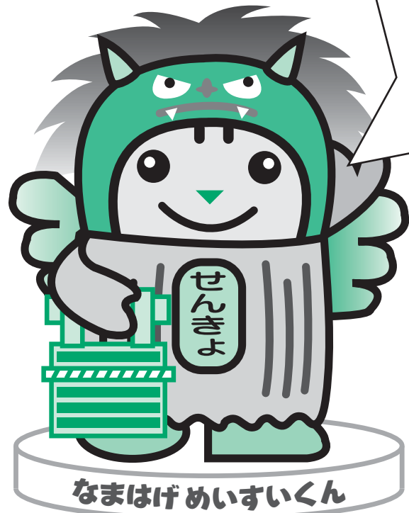
なまはげめいすいくん