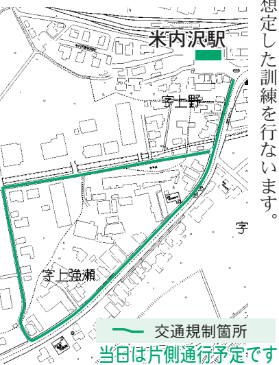
交通規制箇所 当日は片側通行予定です