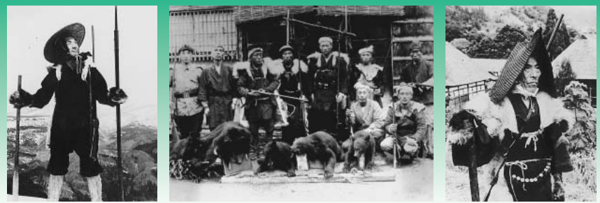
▶採火式の告知看板(部分)。大正から昭和にかけてのマタギと、マタギの掟といえる山達の儀式を紹介