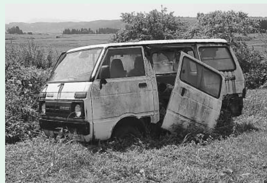
▲物置に使用されている車

市内の農地には不用になった自動車・農機具などをたんぼや畑において、農具等の置場所に利用しているケースがあります。ところが年数が