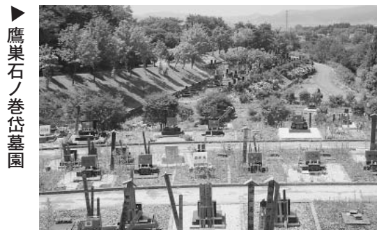
▶鷹巣石ノ巻岱墓園

※募集区画(4区画)以上の申込があった場合は、抽選により決定させていただきます。