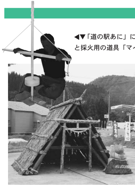
◀▼「道の駅あに」に特設されたマタギ神社と採火用の道具「マイギリ式火起こし器」

「マタギ神社」は阿仁のマタギがかつて猟をしたときのマタギ小屋にあやかつたもの。その昔、マタギたちが山奥深く獲物を求めて狩をするときこの