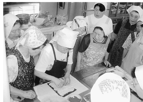
3種類の新メニューを楽しく学んだ前田公民館の料理教室

の数も2日で計40人と人気が高く、和気あいあいと楽しく有意義な一日となりました。