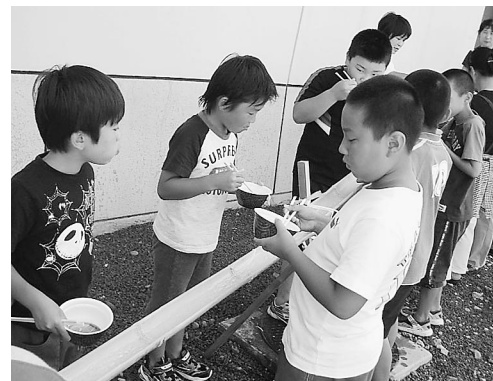
流しソーメンでおなかも夏の思い出もいっぱいになりました

キャンプ体験では、小鳥の巣箱づくり、イワナのつかみどりに挑戦。また、竹を使った流しソーメンでは、