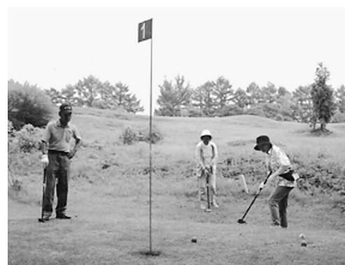
ニュースポーツパークゴルフで心地よい汗を流しました

パークゴルフは初心者でも気軽に楽しめるスポーツ。飛び交い、和やかな時間を過ごしました。