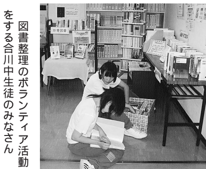
図書整理のボランティア活動をする合川中生徒のみなさん