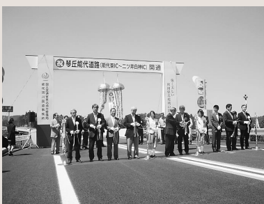
琴丘能代道路全線開通式典及び祝賀会(12日)