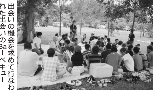
出会いの機会を求めて行なわれた出会いのBa-ベキュー

日程最後の意見交換会では、参加しやすい出会いの場について意見を交換したほか、参加者各自がもう一度話したいと思う人を事務局でまとめ、発表しました。この結果、5組の「カップル」が成立し、名前が読み上げられると、参加者全員から拍手が沸き起こっていました。参加者間ではさらにこの後も話は弾み、互いの連絡先を交換するなど、交流の輪が広がっていたようでした。