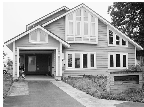
障害者生活支援センター「ささえ」

利用時間 ・月曜日(金曜日) 午前8時30分～午後6時 ・土曜日 午前8時30分～午後3時 日曜・祭日は休館になります が、電話での相談は24時間受け付けます。利用時間は、実施する事業の内容により変更する場合があります。