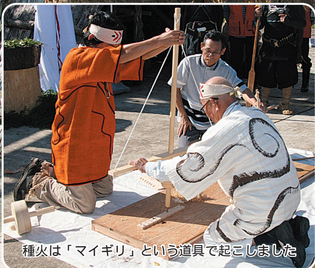
種火は「マイギリ」という道具で起こしました