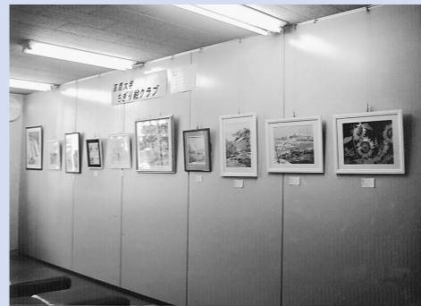
今年度も、公民館講座やサークル活動の作品を1ヵ月単位で展示・紹介します

このように中央公民館ではロビー展を1ヶ月ごとに展示団体を入れ替え紹介していく予定です。皆さんも立ち寄った際には、ぜひ作品をご鑑賞ください。なお、5月はさくら会パッチワーク、鷹巣押花サークル、フォトぶあー(カメラクラブ)の作品を展示予定です。