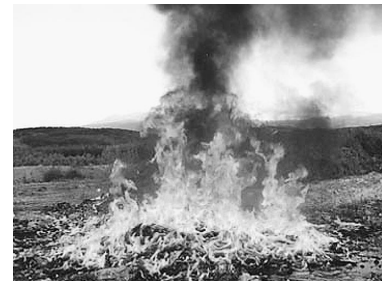
野焼きはやめましょう

暖かくなり、野焼きに関する苦情が出始めており、野焼きが原因と思われる原野火災も発生しています。中には、土日や夜間など、注意されにくい時間帯等を狙って野焼きをされているケースもあるようです。焼却施設を使わずに屋外で焼却した場合、ダイオキシン類が発生し、周囲の生活環境に悪影響を及ぼす可能性があります。廃棄物処理法及び秋田県公害防止条例の規定により、野焼き行為は処罰の対象です。