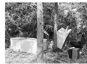
ストップ!! 不法投棄

この自然豊かな美しい北秋田市にも、廃棄物の不法投棄があつとを絶ちません。空き缶などのポイ捨てごみ、テレビや冷蔵庫などの家電ごみ、農機具、車やタイヤなど、処理に困るものがごみとして沢山捨てられています。中には、「ごみを目立たないようにするためか、わざとごみを道端から谷底に落とすように捨てている悪質なケースも確認されています。悪質な不法投棄事件は警察に引き渡し、処罰を受けたケースも何件もあり、数十万円もの罰金刑に処せられています。」