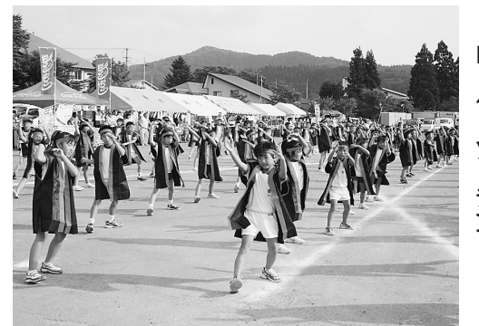
前田小学校児童のロック・ソーラン