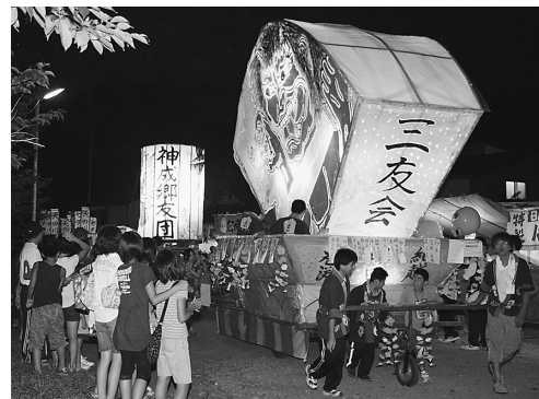
各集落で制作した9台が巡行した絵灯籠大行列

財に指定されている阿仁前田獅子踊りなどが披露されました。日が沈み、あたりが夕闇に包まれた午後7時には、祖先の供養と豊作や家内安全など地域の願いを込めて作られた各地の絵灯籠大行列が内陸線阿仁前田駅前を出発、集落内をお囃子に合わせて練り歩きました。