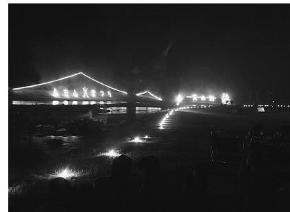
幻想的な火文字と花火で観客を魅了

この後、火祭太鼓の演奏で会場を盛り上げるなか、割物やスターマインなどの花火が次々に打ち上げられたほか、スキーヤーが滑降する姿やあきた北空港を飛び立つ飛行機、三階の滝などを炎と仕掛花火で演出し、会場を喜ばせました。