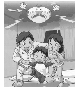
消防法で全ての住宅に住宅用火災警報器の設置が義務付けられました

建物火災における死者数のうち、約9割は住宅火災で亡くられており、そのうち、火災の発生に気づくのが遅れて「逃げ遅れ」により、多くの方が亡くなっています。 住宅用火災警報器は、煙や熱を感知して、警報音や音声で火災発生を知らせ、大切な家族や家財を守る見張り人です。 北秋田市では、設置の推進を図るため、次のとおり補助金を交付しています。(平成23年6月1日までに) 【対象】自治会や町内会、婦人防火クラブが共同購入する場合 【金額】共同購入世帯数に300円を乗じた額 【期間】平成22年3月31日まで ☎ 消防本部 ☎62-1119 合川分署 ☎78-2119 森吉分署 ☎72-3119 阿仁分署 ☎82-2119