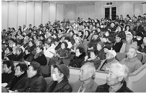
市内の高齢者大学受講生が一堂に会し、講演とトークショーで学習と交流を深めました

市内の高齢者大学生が一堂に会する北秋田市高齢者大学全体公開講座が2月16日、市文化会館で開催され、受講生や一般参加者約450人が講演とトークショーで学習と交流を深めました。