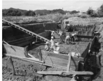
胡桃館遺跡発掘当時