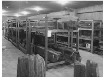
胡桃館遺跡収蔵庫内部