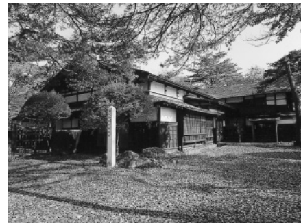
▲北秋田市指定有形文化財「長岐邸」