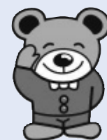
森吉のじゅうべえ