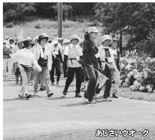
あじさいウォーク