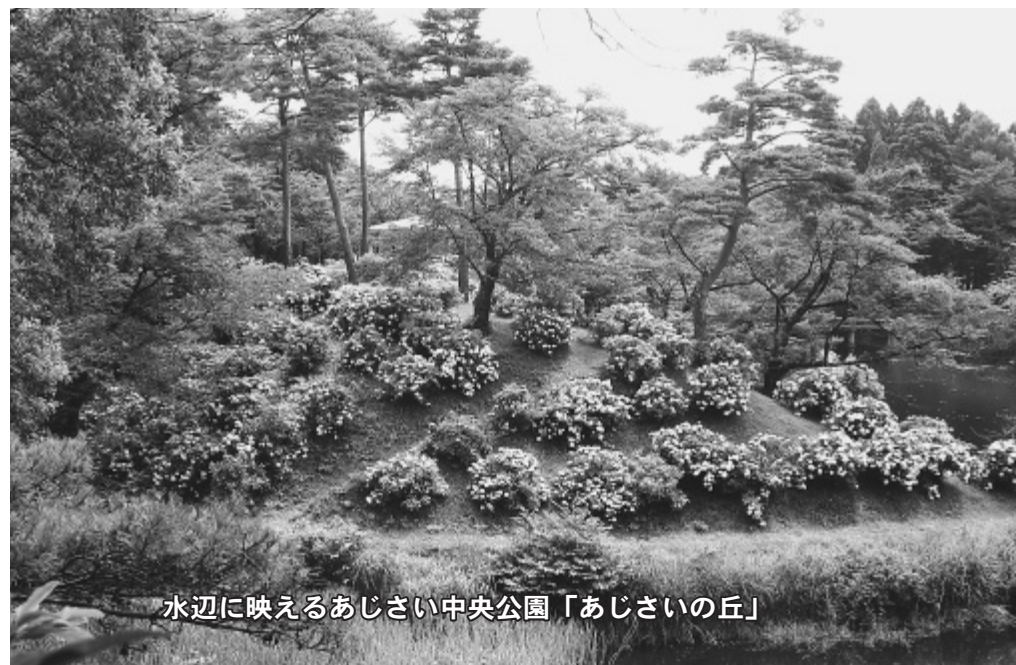
水辺に映えるあじさい中央公園「あじさいの丘」