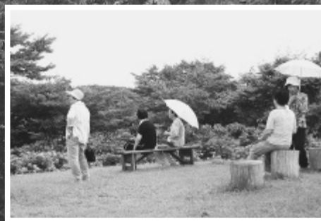
色とりどりのあじさいが咲く「翠雲公園」