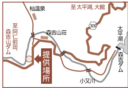
㊦ 北秋田地域振興局建設部 森吉ダム管理事務所 ☎76-2448

森吉ダムでは、貯水池内で採取した流木を、市民のみなさまに無償で提供します。《無くなり次第終了》 提供期間 10月12日(火)～15日(金) 提供時間 9時～15時 提供場所 北秋田市森吉字湯ノ岱地内(森吉山荘約1km手前) 提供条件 自分で取りに来れること 転売等、営利目的に使用しないこと 独占しないこと 利用する方は、氏名、住所、利用目的を記入し、現場作業員にしたがうこと