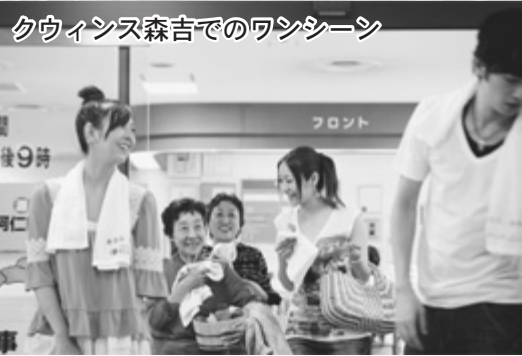
大館能代空港での撮影風景