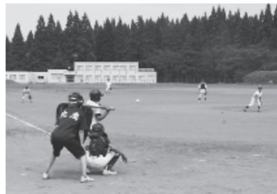
▲交流を深めた第49回合川少年球技大会野球の部

第49回合川少年球技大会が8月8日、合川野球場、旧合川高校野球場、合川体育館で行われ、参加した合川地区の小中学生が野球とミニバスケットボールで交流を深めました。球技大会は、合川親の会連絡協議会と合川公民館が主催し、子どもたちの健全育成活動の一環として心身の健康増進と親睦交流を深めることを目的に、小中学生の夏休みに合わせて行われています。大会には、男子の野球7チームと女子のミニバスケットボールに5チーム、児童生徒約140人が参加しました。野球では秋田北鷹高校野球部員、ミニバスケットボールでは合川バスケットボール協会の皆さんや中学生が審判を行うなど児童生徒の交流が行われました。