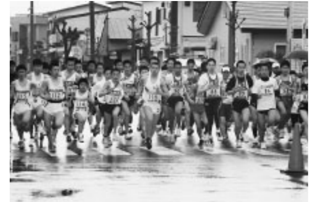
▲今シーズンの陸上競技の開幕を告げる河田杯マラソン(4/16)