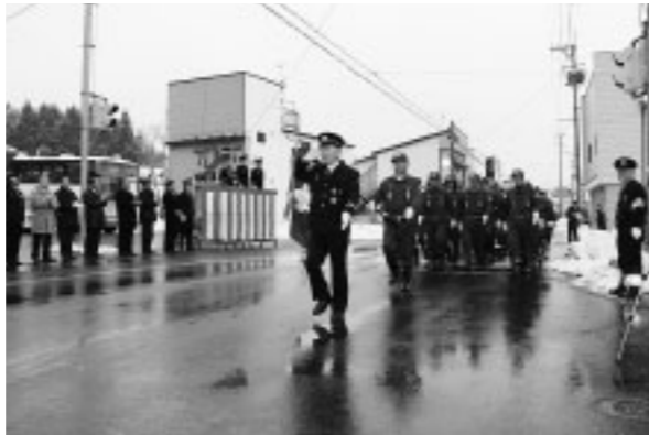
▲決意を新たに 新春恒例の「消防出初式」(1/4)