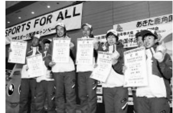
▲あきた鹿角国体2011で北秋田市勢が大活躍(2/14)