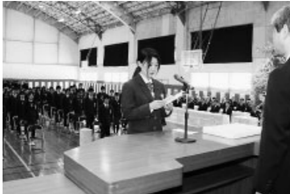
▲合川高等学校で最後の卒業式(3/21)