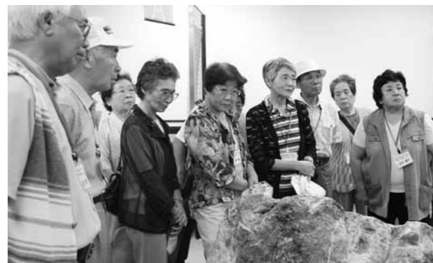
▲鉱石の説明を聞く合川ことぶき大学の皆さん

で発光する鉱物の色鮮やかな美しさに驚くなど、地球の不思議を再発見する研修となりました。