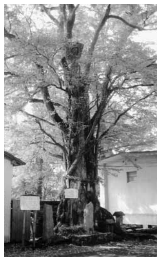
▲千年桂(綴子神社境内)