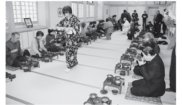
▲再現された殿様御膳を味わう参加者