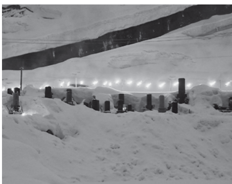
▲巻渚の万灯火（平成24年3月撮影）