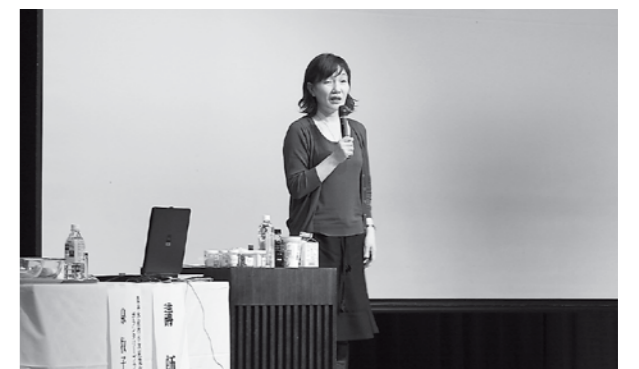
▲講演などで市民らが理解を深めたセミナー

意識的に摂り、次代の子どもたちに文化をつないでいかなければならない」などと述べました。