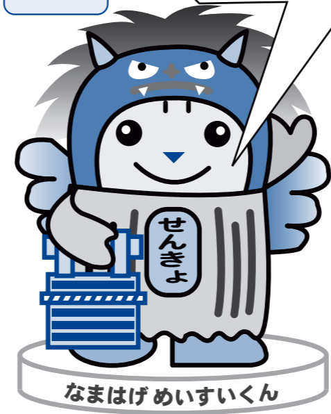
なまはげめいすいくん 北秋田市選挙管理委員会 北秋田市明るい選挙推進協議会