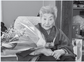
ご自宅で祝品贈呈式が行われました(3月22日)