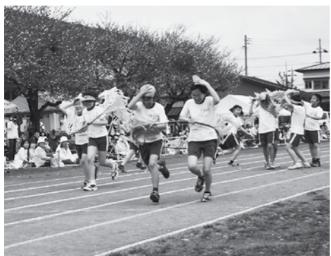
▲児童がのびのびと遊競技を繰り広げた鷹巣小学校の運動会

各小・中学校の運動会・体育大会は5月11日を皮切りに行われ、家族や地域の方々の声援を受けながら元氣いっぱい躍動する子どもたちの姿が見られました。