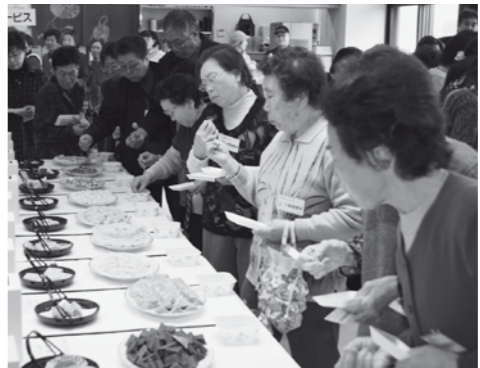
▲「B.M.-1 グランプリ」でバター餅を吟味する一般審査員

緊急雇用創出等臨時対策基金事業関係は、県の基金事業を活用し6事業19人を新規に雇用しています。