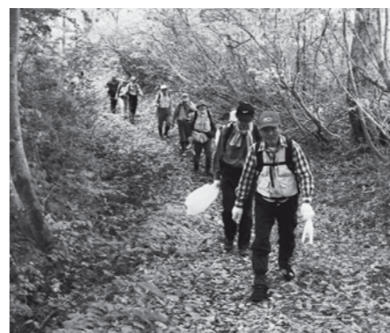
▲森吉山阿仁側コースの山開きでは、登山道の清掃も行いました。

「森吉山山開き」は、森吉側が5月3日、阿仁側が6月8日に、また「竜ヶ森山開き」が6月1日に行われました。今年は残雪が非常に多く、