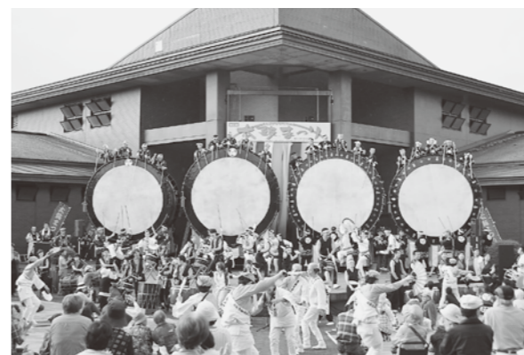
▲出演者が総出演して最後を締めくくった太鼓まつり

第11回北秋田市たかのす太鼓まつりが9月8日、大太鼓の館野外ステージで開かれ、迫力ある太鼓演奏とパフォーマンスを観ようと、県内外から大勢の観客が詰めかけました。今年は市内から9団体と上小阿仁村の「上小阿仁和太鼓保存会 鼓響」のほか、特別ゲストとして、仙臺すずめ踊り「仙千代祭連」、仙北市の創作和太鼓「桂組」、宮城支部「琉球國祭り太鼓」が出演し、見事な踊りと力強いバチさばきの演奏で観客を楽しませました。ファイナーでは、綴子上町・下町大太鼓保存会が合同演奏を披露し、4張りの大太鼓が共鳴する迫力ある轟き音で魅了したほか、出演者が総出演し盛大に最後を締めくくりました。