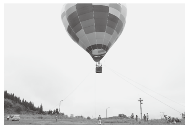
▲今年も家族連れに大人気となった、熱気球搭乗体験

空の日と空の旬間を記念する「大館能代空港スカイフェスタ2013」が9月8日、大館能代空港で開かれ、空港関係車両の展示や熱気球体験搭乗など多彩なイベントでにぎわいました。熱気球搭乗体験は、事前申し込みの抽選で当選した方のみが搭乗できる、毎年大人気のイベント。搭乗した人たちは、上空から、下で見守る家族や友人に向かって楽しそうに手を振っていました。また、滑走路を見学するバスツアーの「空港探検隊」や、飛行機の牽引車など「空港で働くクルマの展示」、パイロットと客室乗務員の「ちびっ子制服試着コーナー」、「空港クイズラリー」なども企画され楽しめました。