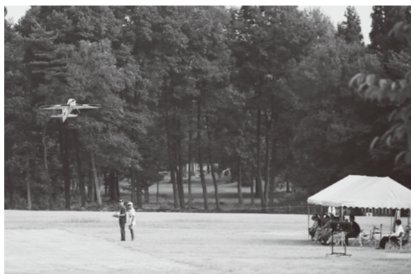
▲模型飛行機を巧みな技術で操作し、曲技を披露する選手

ラジコン飛行機の操作技術を競う第51回F3Aラジコン曲技日本選手権が、9月13日・14日、県立北欧の杜公園で開かれました。日本選手権は日本模型航空連盟の主催で、年1回開催されており、同公園で開かれるのは4年ぶり5回目。全国7ブロックの予選を勝ち抜いた40人の選手が出場し日本一を目指しました。競技は、主翼、胴体が各2m以内、重さ5kg以内の模型飛行機を使用し、8分以内に宙返りやロールなど規定に盛り込まれた17種目の曲技の正確さを競うもの。会場では、ラジコンファンや一般の見物客が、空を見上げて飛行機を目で追いながら、華麗な飛行に見入っていました。