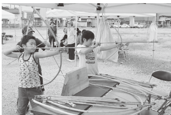
▲弓矢の的当てコーナーで、縄文時代の狩猟文化を体験

国指定史跡「伊勢堂岱遺跡」など市の縄文遺跡と文化をPRする「第13回北秋田市縄文まつり」が9月14日、北秋中央病院跡地で開催され、子どもたちや考古学ファンらが土偶や勾玉づくりなどで縄文時代の文化を体験しました。会場では、当時の装飾品だった「勾玉（まがたま）」をつくるコーナーや、土器・土偶づくり、弓矢の的当て、火おこし体験のほか、縄文時代の衣装を着ての記念撮影や縄文をイメージした歌や踊りを披露する「縄文音楽祭」なども盛りだくさんのイベントで縄文文化をPRしました。各コーナーでは、伊勢堂岱遺跡ワーキンググループ等がボランティアとして協力し、まつりを盛り上げました。